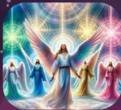
Canalización de Ángeles Todos Somos Uno 17:00-18:00