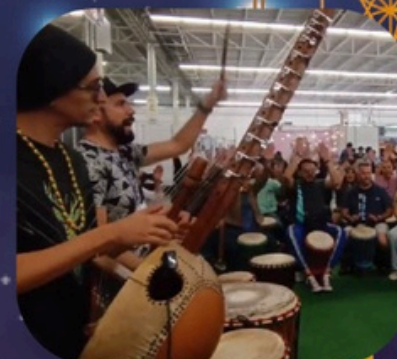
Círculo de Tambores Yuku Percusiones 14:30-16:00