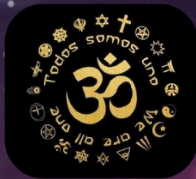
ThetaHealing Todos Somos Uno 16:00-17:00